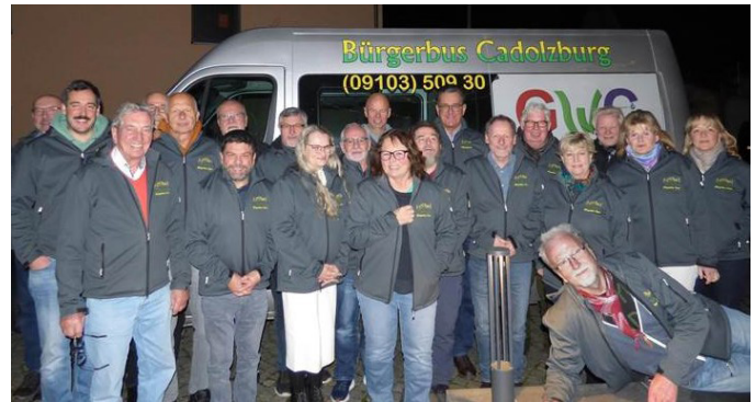
Das Bürgerbus-Team im Dezember 2024

Eine Initiative des Seniorenbeirats Cadolzburg und ein Erfolgsmodell seit 2018 ist der BBC - Bürgerbus Cadolzburg. 2024 wurden vom Bürgerbusteam 5206 Beförderungen gestemmt, gut 16% mehr als im Jahr 2023. Dies war nur zu leisten, weil im Lauf des Jahres sieben neue ehrenamtliche Fahrer gewonnen werden konnten. Da der Bürgerbus an jedem Wochentag von Montag bis Freitag (außer an Feiertagen) im Einsatz ist, mussten für 247 Tage die Einsatzpläne erstellt werden. Das heißt: Anrufbeantworter mit den Fahrtbestellungen mehrmals am Tag abhören, in den Einsatzplan des Folgetages eintragen, zeitliche Überschneidungen durch Rückruf bei den Fahrgästen korrigieren, um Verständnis für etwaige Wartezeiten bitten. Diese zeitraubende (und manchmal auch nervenaufreibende) Aufgabe wird hauptsächlich von einem Einsatzplaner bewältigt, dessen Engagement nicht hoch genug geschätzt werden kann. Für die 15 Fahrer und fünf Fahrerinnen bedeutet die ansteigende Beförderungszahl natürlich eine Verdichtung der Fahrten inner-